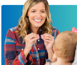
Proveedores de cuidado infantil