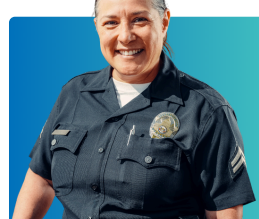
Agentes oficiales y policías

Los informantes obligatorios deben presentar un informe a CPS cuando creen que un niño o joven ha sido abusado o hay negligencia . No están obligados a demostrar que el abuso ha ocurrido, sólo a compartir inquietudes para que CPS pueda revisarlas.