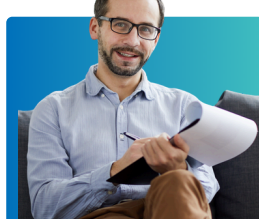
Consejeros y terapeutas