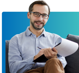
Washauri na wataalamu wa matunzo ya kisaikolojia