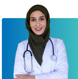
Banganga, wauguzi, na wahudumu wengine wa afya