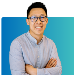
Wa limu na wafanyakazi wa masomo