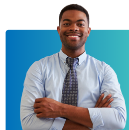
Wafanyakazi wa kijamii na wasimamizi wa kesi