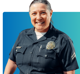
Maafisa wa kufuatilia sheria

Batu benye banahusika na utowaji wa habari wa lazima banapashwa toa habari kwa CPS . wakati bako na uhakika kama mtoto amenyanyaswa ao amezarauliwa. Habalazimishwe kuonyesha alama ya ukweli kama unyanyasaji imefanyika — banatakiwa tu kutoa habari kuhusu wasiwasi kusudi ichunguzwe na CPS.